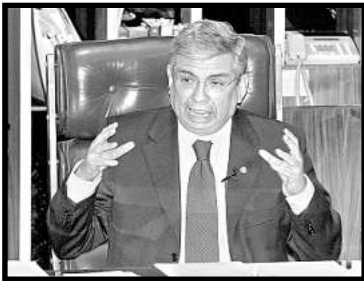
12/12/07

Garibaldi somente se viabilizou como presidente do Senado porque manteve boas relações com os líderes oposicionistas e soube se tornar palatável para o Palácio do Planalto. O presidente Lula não gosta de Garibaldi Alves, por causa da CPI dos Bingos, que ficou conhecida como "CPI do Fim do Mundo", da qual foi relator. Lula fez tudo o que podia — e até o que não devia, como interferir di-