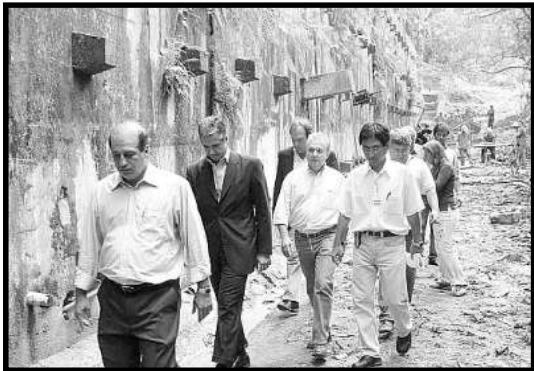
Ministros do tribunal vistoriam obra federal: fiscalização para coibir desvios de recursos