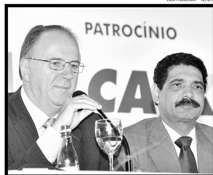
Presidente da Confederação Nacional dos Municípios, Paulo Ziulkoski, e o prefeito de Recife, João Paulo, são favoráveis à reforma tributária

Já o presidente da Confederação Nacional de Municípios, o peemedebista Paulo Ziulkoski, declara que a entidade pressionará os parlamentares a aprovarem o rateio da CPMF. Ele também negocia com o governo a reforma tributária, mas teme que seja abandonada depois de aprovada a prorrogação da cobrança da contribuição. Adversário no duelo sobre a CPMF, Ziulkoski diz que o presidente Lula tem uma “relação mais qualificada” com os prefeitos. Teria atendido boa parte da agenda municipalista. É com base nesse crédito que o Planalto descarta a possibilidade de divisão da arrecadação. A mesma lógica vale para o caso dos estados. Depois da cerimônia de anúncio dos investimentos em saneamento e urbanização, governadores deixaram claro que não farão da votação da CPMF um cavalo de batalha.