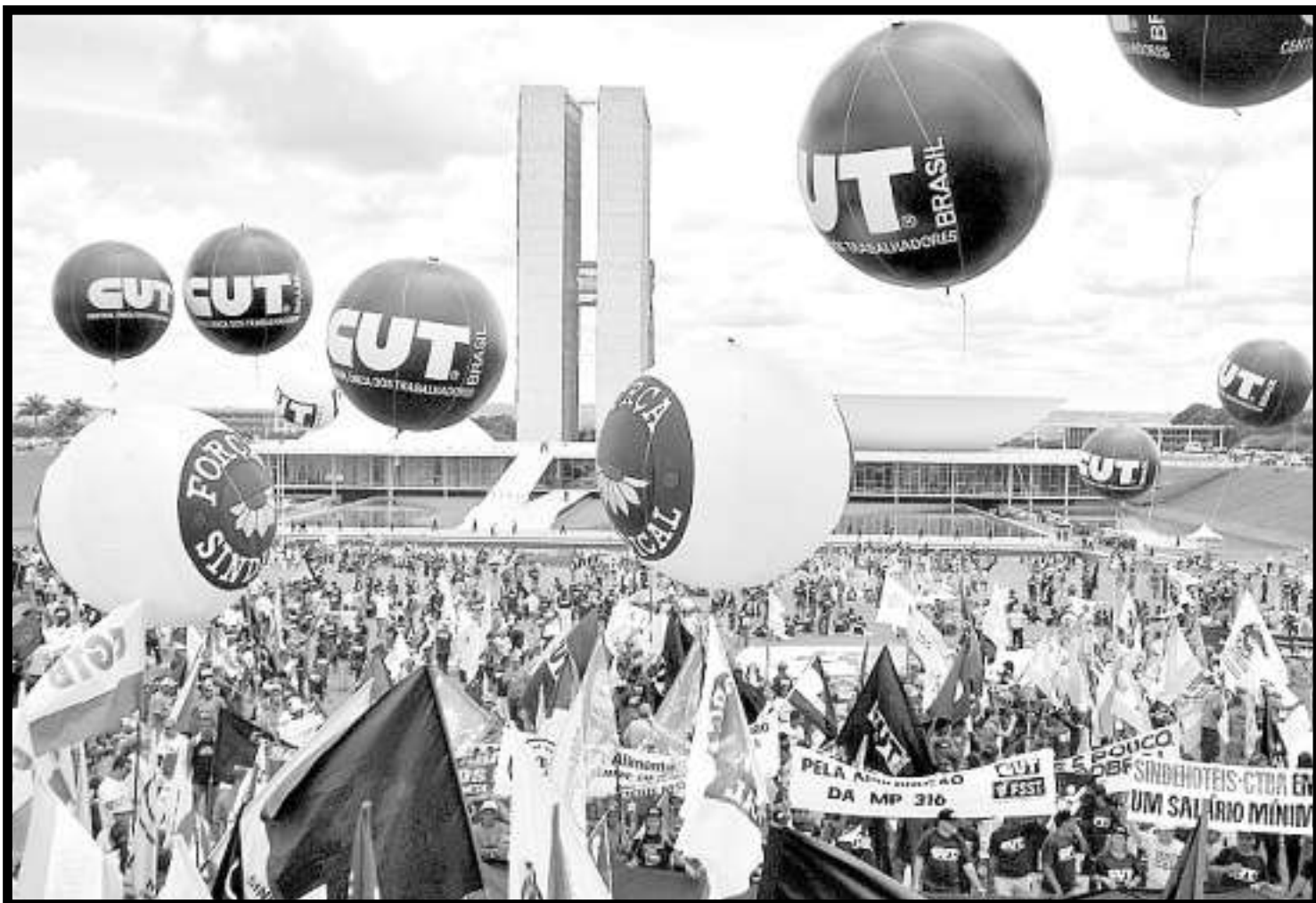
Manifestação de centrais sindicais em Brasília. Com mais representantes no parlamento, elas sonham melhorar a influência no Legislativo

Uma das principais críticas de dirigentes sindicais é o desequilíbrio de forças no Congresso entre representantes dos tra-