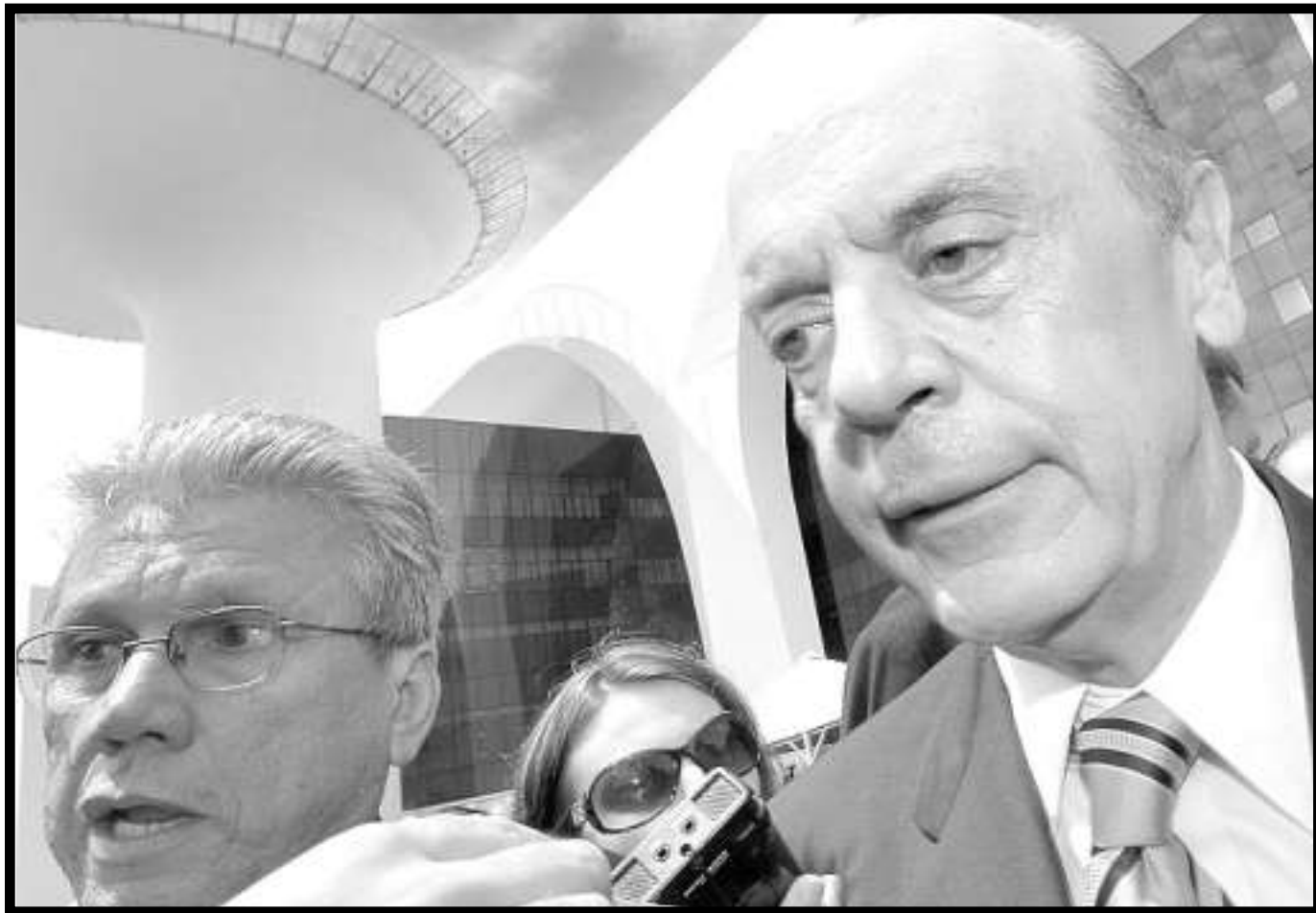
Governador José Serra intensifica as viagens pelo interior do estado de São Paulo, com várias inaugurações, e PSDB mobiliza militantes

Na sexta-feira, Serra desistiu de comparecer ao aniversário do senador Marconi Perillo (PSDB-GO), uma festa que pretendia reunir mais de mil pessoas. Tudo para não desmarcar a agenda de inaugurações previamente acertada em São Paulo. Foi para Botucatu entregar cinco viadutos da Rodovia Castello Branco (SP-280). Antes, passou por Avaré, para anunciar a ampliação do Programa Vila Dignidade – um projeto de constru-