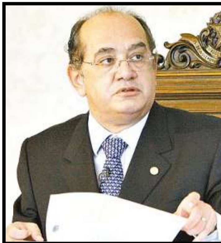
Gilmar Mendes considera que morosidade do Judiciário é um mito