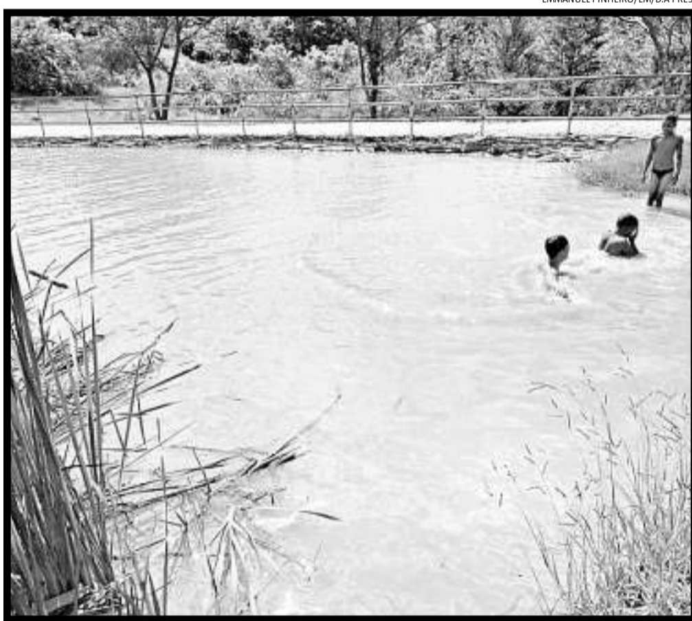
Nascente de córrego que abastece a Lagoa da Pampulha: projeto de recuperação foi excluído